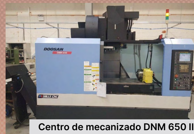
Centro de mecanizado DNM 650 II