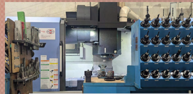
Centro de mecanizado DNM 750 II