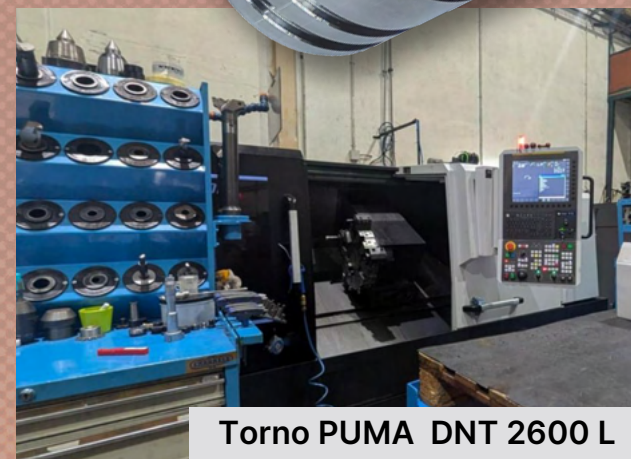
Torno PUMA DNT 2600 L